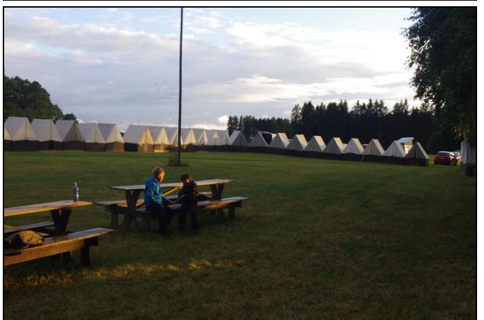
Stavba tábora 2019 – vedoucí – od pátku 21. 6. do neděle 23. 6. 2019 Stavba tábora 2019 – rodiče a členové – sobota 22. 6. – Děkujeme!