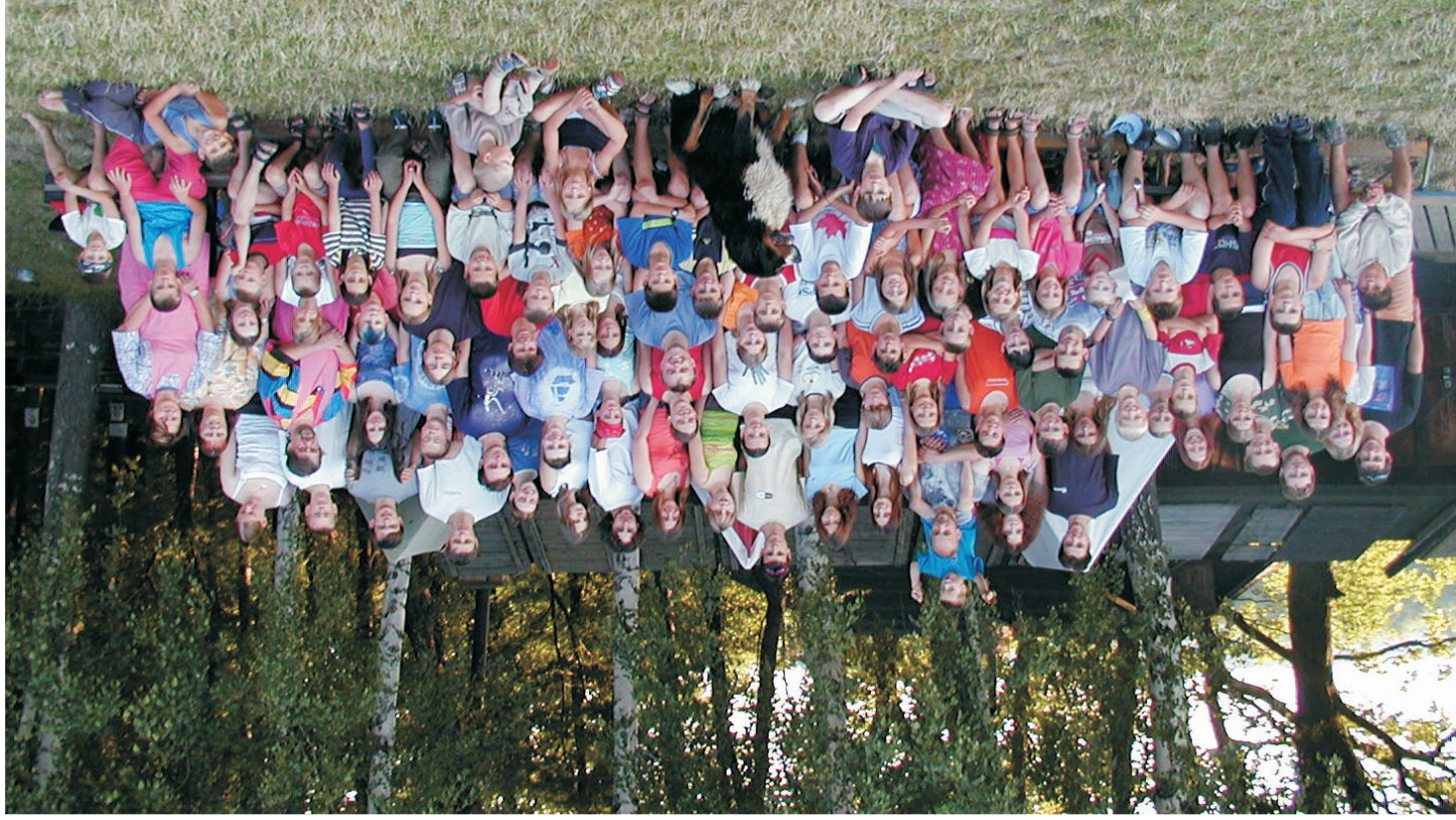
Na fotografii možná jsou: